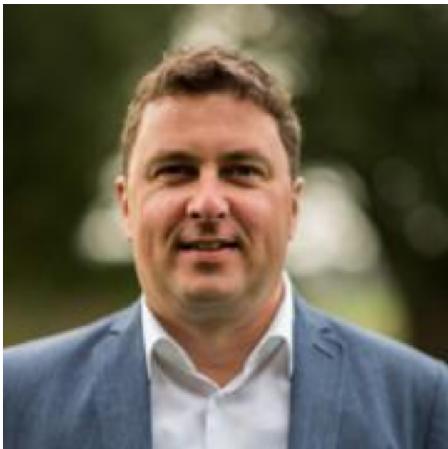
Christ Defoszé Aankoop en Contractenbeheer