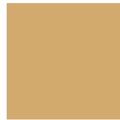
Zand RAL 1002